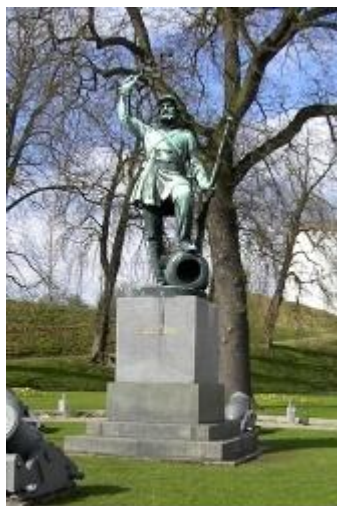
Монумент "Неизвестный пехотинец" в Дании

Могила Неизвестного Солдата – памятник погибшим во время войн военнослужащим, личность которых установить не удалось. Первый такой памятник был установлен в 1858 году в Дании.