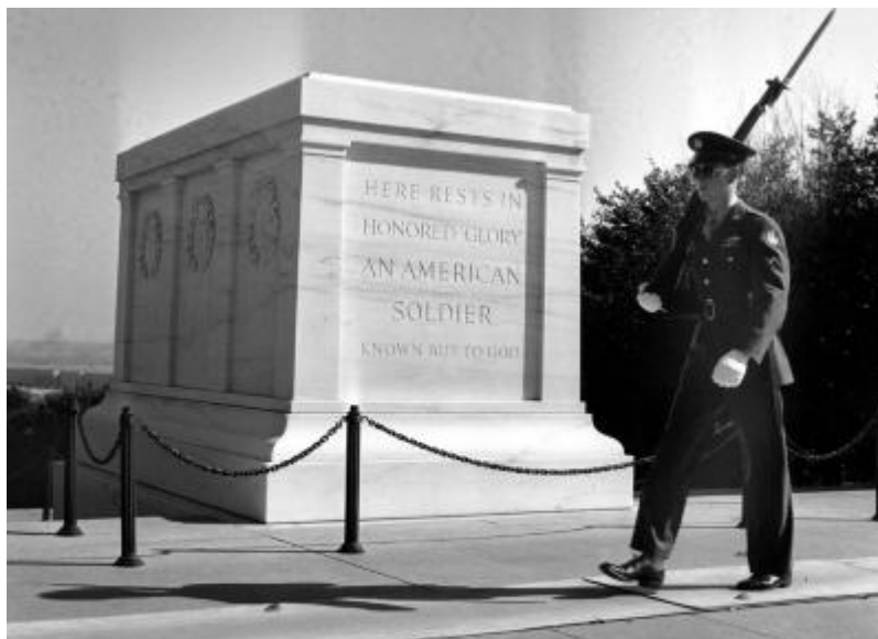
Мемориал неизвестным солдатам на Арлингтонском национальном кладбище под Вашингтоном

В XX веке первые могилы (мемориальные комплексы) Неизвестного Солдата появились в 1920 году в Великобритании и Франции, а за ними и в других странах – как членах Антанты, так и их противников. В 1921 году церемонии захоронения Неизвестного Солдата прошли в США, Италии, Бельгии и Португалии, в 1922 году – в Чехословакии и Югославии, а в 1923 году – в Румынии; до конца 1920-х годов подобные мемориалы были сооружены в Болгарии, Австрии, Венгрии, Польше и Греции. Сегодня их насчитывается свыше сорока, большинство посвящено павшим в двух мировых войнах. Как правило, такие памятники воздвигают на могиле, в которой покоятся останки погибших солдат, личность которых установить не удалось. Однако это могут быть и символические могилы (без захоронений).