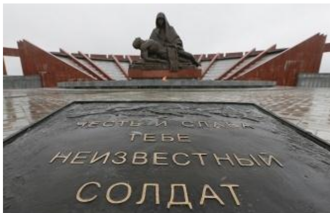
Монумент "Скорбь", посвященный памяти воинов, павших за Отечество, на территории федерального военного мемориального кладбища в Мытищинском районе

Первая в Советском Союзе Могила Неизвестного Солдата появилась в Москве. 10 ноября 1966 года, в преддверии 25-й годовщины разгрома немецких войск под столицей, ЦК КПСС принял постановление о сооружении в Александровском саду у стен Кремля памятника «Могила Неизвестного Солдата» с Вечным огнем Славы. Вопросами перезахоронения занималась комиссия, созданная Московским городским комитетом КПСС, первым секретарем которого являлся Николай Егорычев.